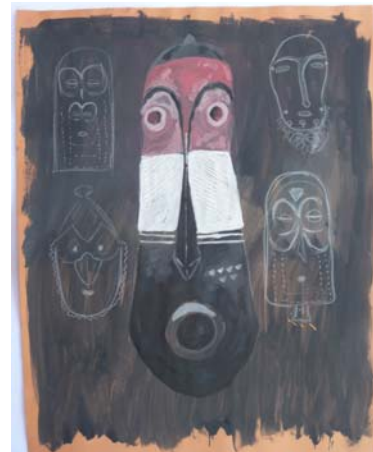
Радови полазника Сликашког атељеа „Морариу“ Вршац