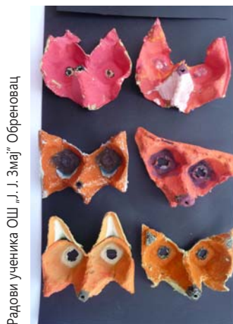
Радови ученика ОШ „Ј. Ј. Змај“ Обреновац

Сваке године дивимо се дечјој искрености и маштовитости, а овогодишња изложба донела је нове идеје и решења по којима се види да деца с великим успехом примењују разне материјале и нове приступе у реализацији својих радова. У складу са савременим трендовима у уметности, и најмлађи у свом стваралаштву радо употребљавају рециклирани материјал. Деца користе картонску и пластичну амбалажу као