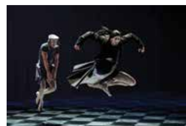
Почасно ФИАП признање фотографу: Иштвану Хуису, Мађарска