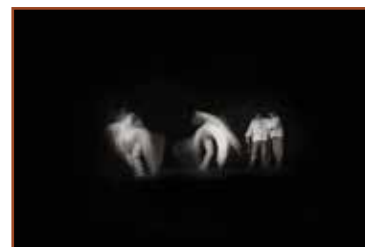
ФСС награда фотографу: Андреју Беловезчику, Словачка