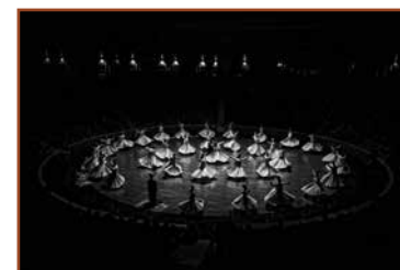
ФСС награда фотографу: Бандуу Гунаратнеу, Шри Ланка