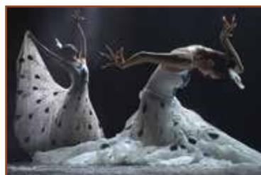
ФСС сребрна медаља: Мариан Плаино, Румунија, Паунови 1