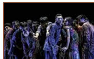
ФСС награда фотографу: Шиушун Ли, Кина